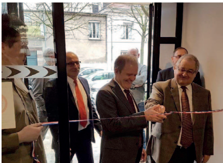
Inauguration des nouveaux locaux du FONGECIF Grand Est à Reims.