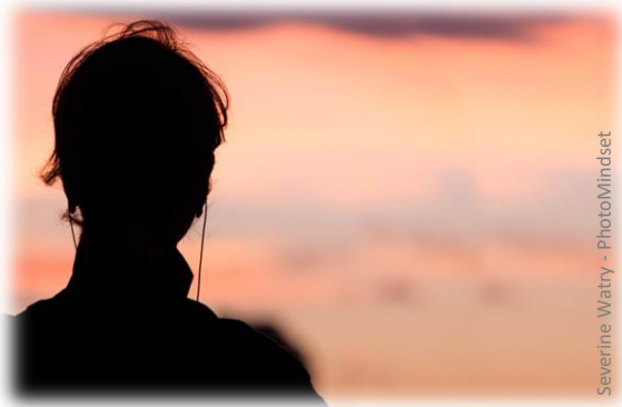
Severine Watry - PhotoMindset

Répondons-y d'abord pour nous concentrer sur les 2 essentiels : « pourquoi ? » et « comment ? ».